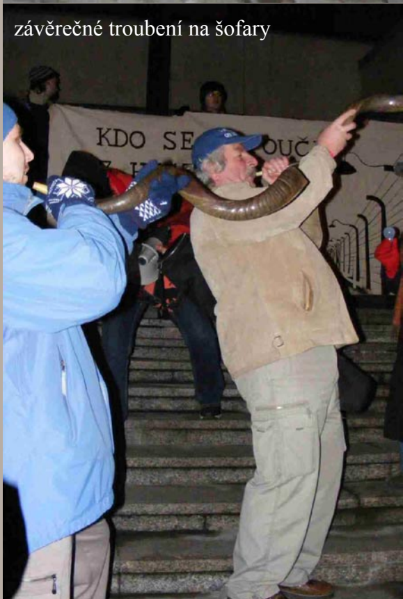
závěrečné troubení na šofary