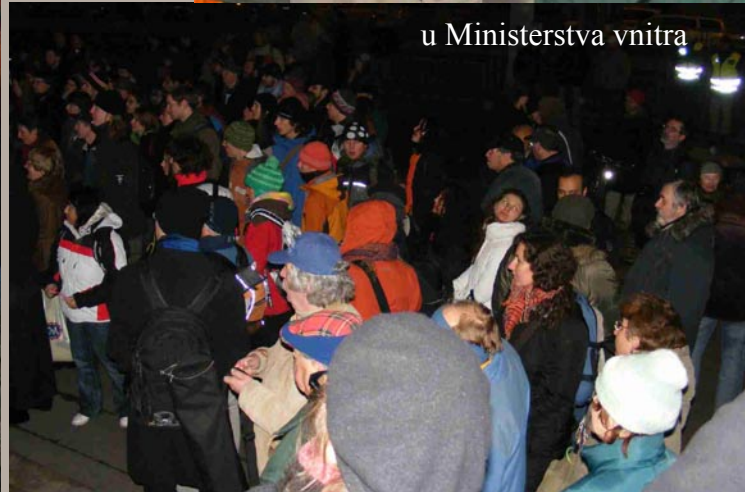
u Ministerstva vnitra