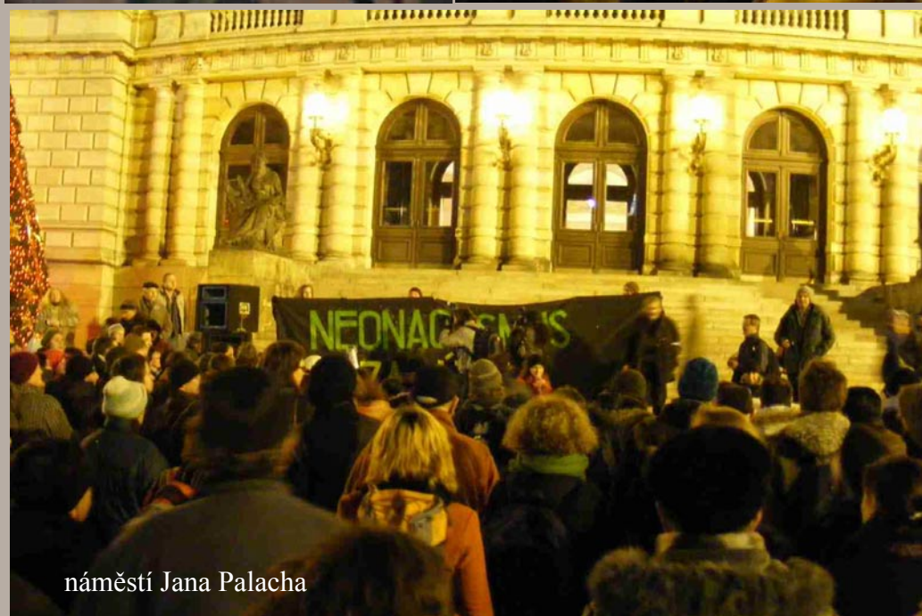
náměstí Jana Palacha