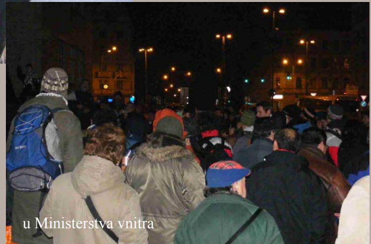
u Ministerstva vnitra