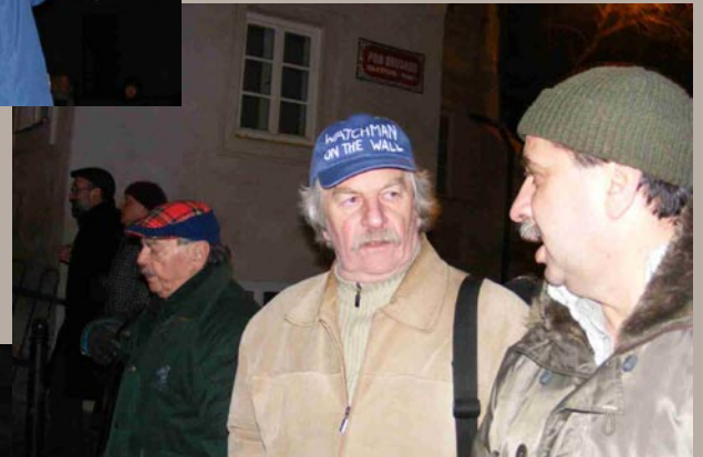
na cestě na Letnou, otázka: proč troubíte?