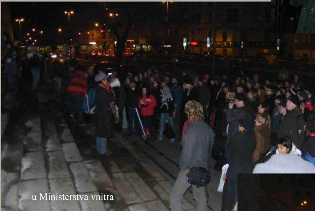
u Ministerstva vnitra