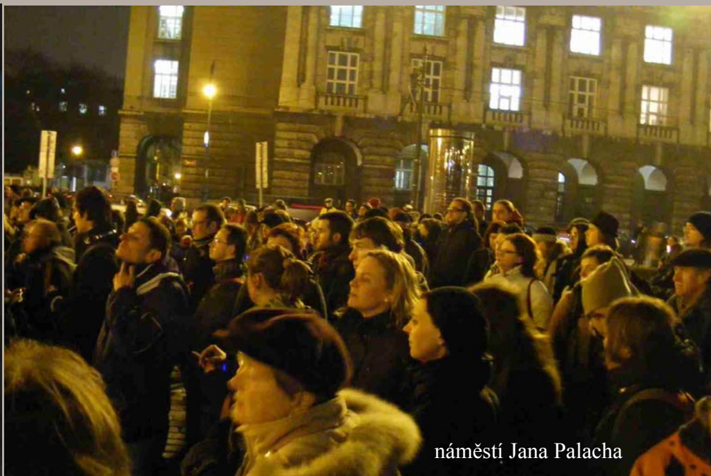
náměstí Jana Palacha