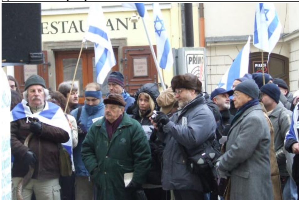
část davu demonstrantů