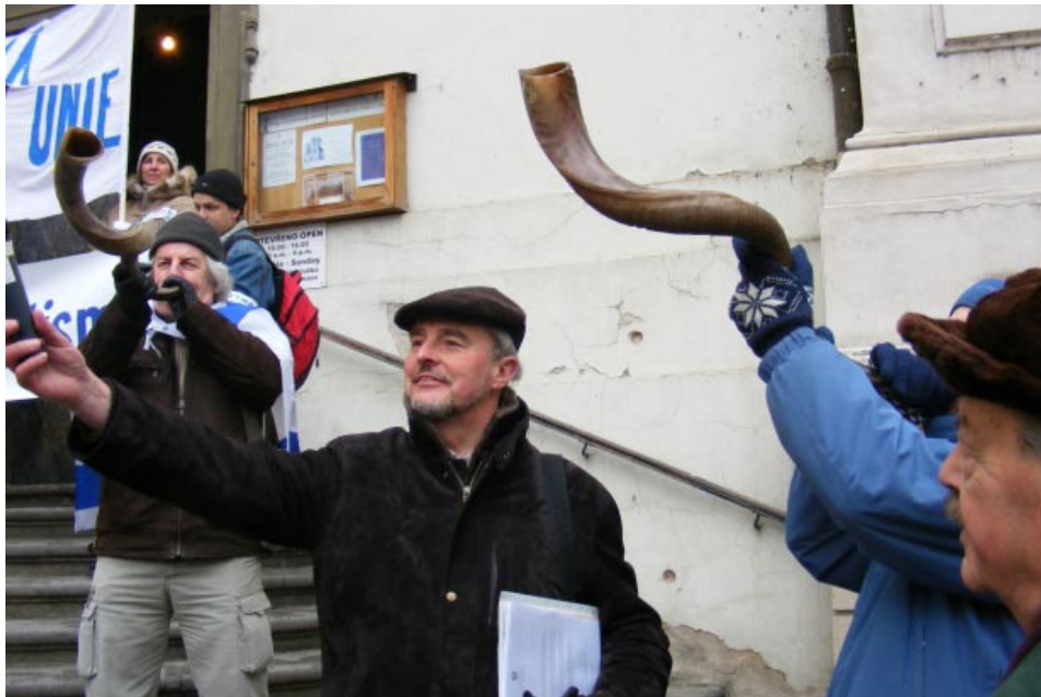
troubení na šofary