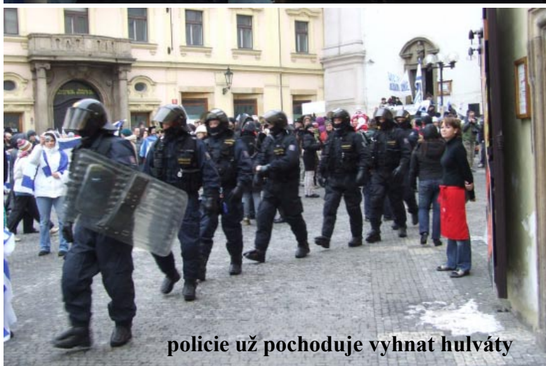
policie už pochoduje vyhnat hulváty