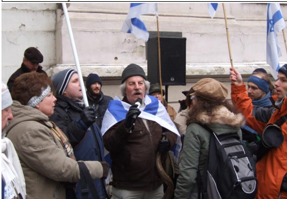
zpěv israelské hymny Hatikva